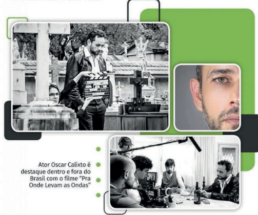
Ator Oscar Calixto é destaque dentro e fora do Brasil com o filme “Pra Onde Levam as Ondas”